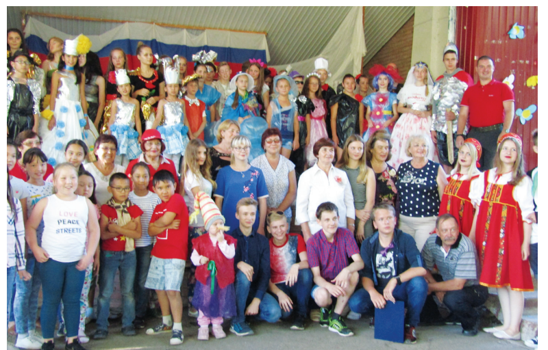
Команда школы – на слете

Слет – это своего рода ежедневная работа по определенной тематике. Здесь небольшая группа детей и педагогов представляет деятельность всей школы. Одно-