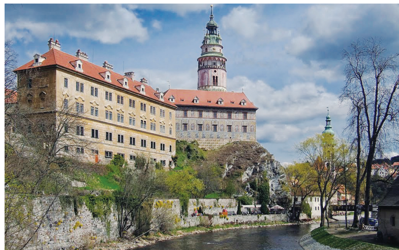
Средневековая громада Крумловского замка впечатляет и снаружи, и изнутри

А на всем протяжении пути из Варшавы в чешскую столицу по обеим сторонам дороги простирались зеленые газоны – ни дать ни взять лондонский Гайд-парк, кромка которого вдали местами обозначена белой пеной цветущих деревьев. Весна в самом разгаре!