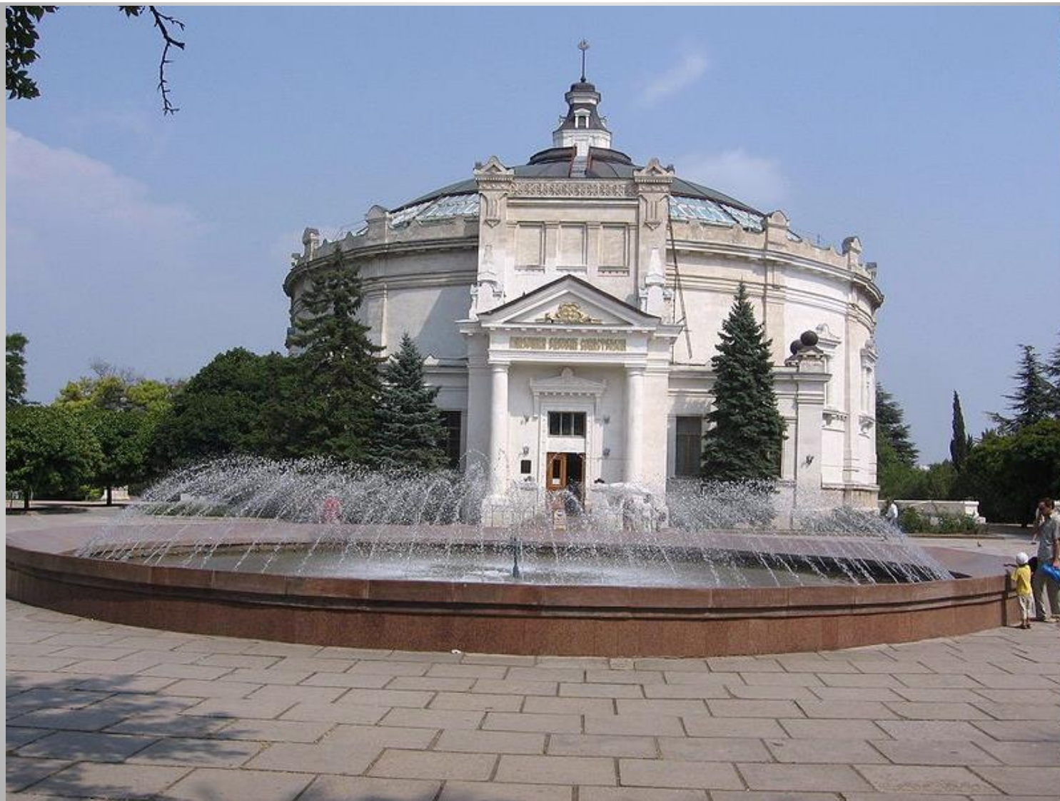
Музей-панорама «Оборона Севастополя 1854-1855 гг.»