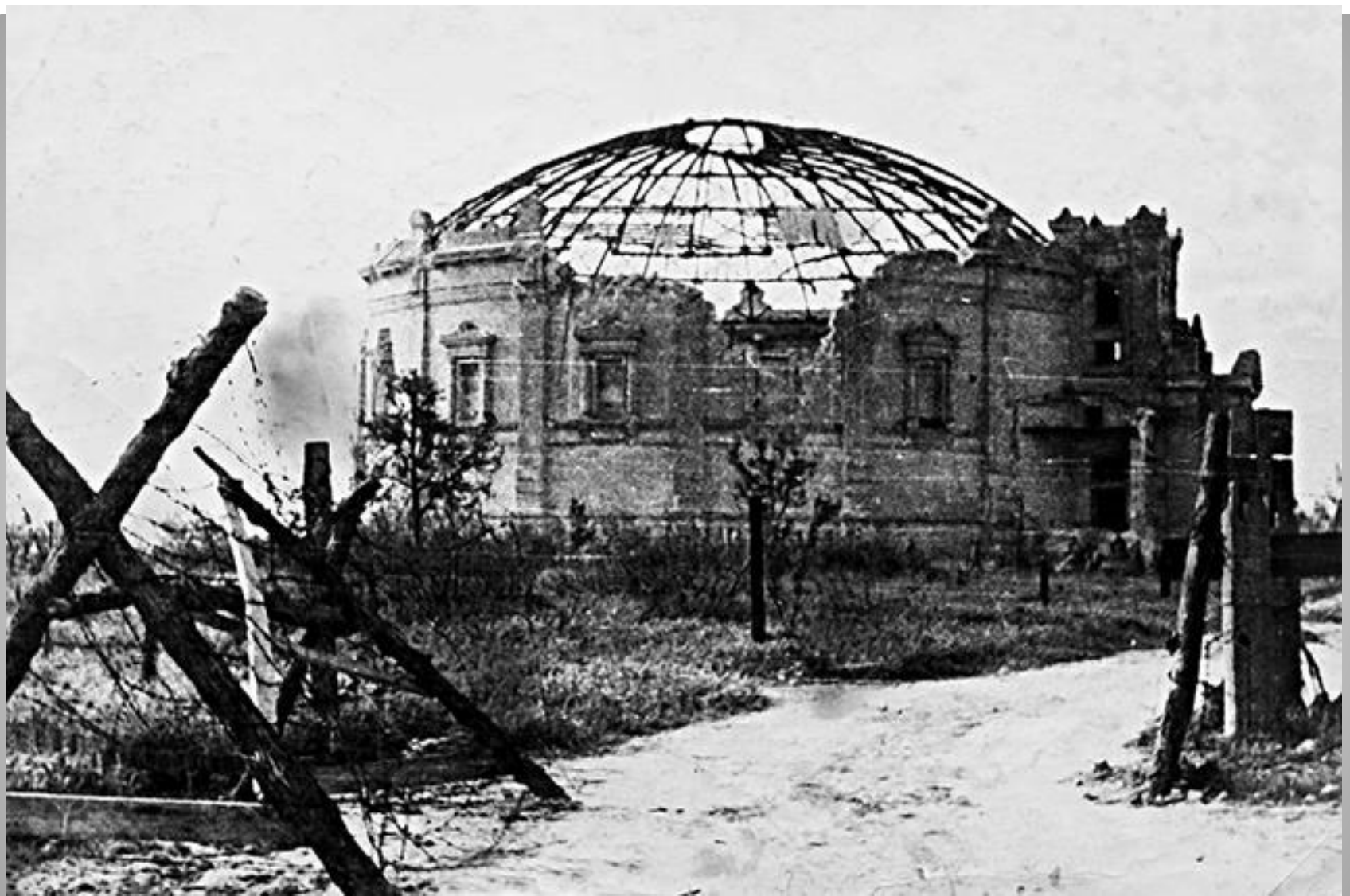
Фотография 1944 года